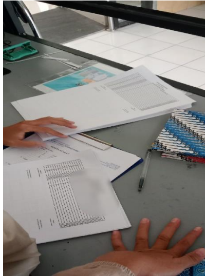
Gambar 2. Aktivitas cek asset dan persediaan (stock opname)