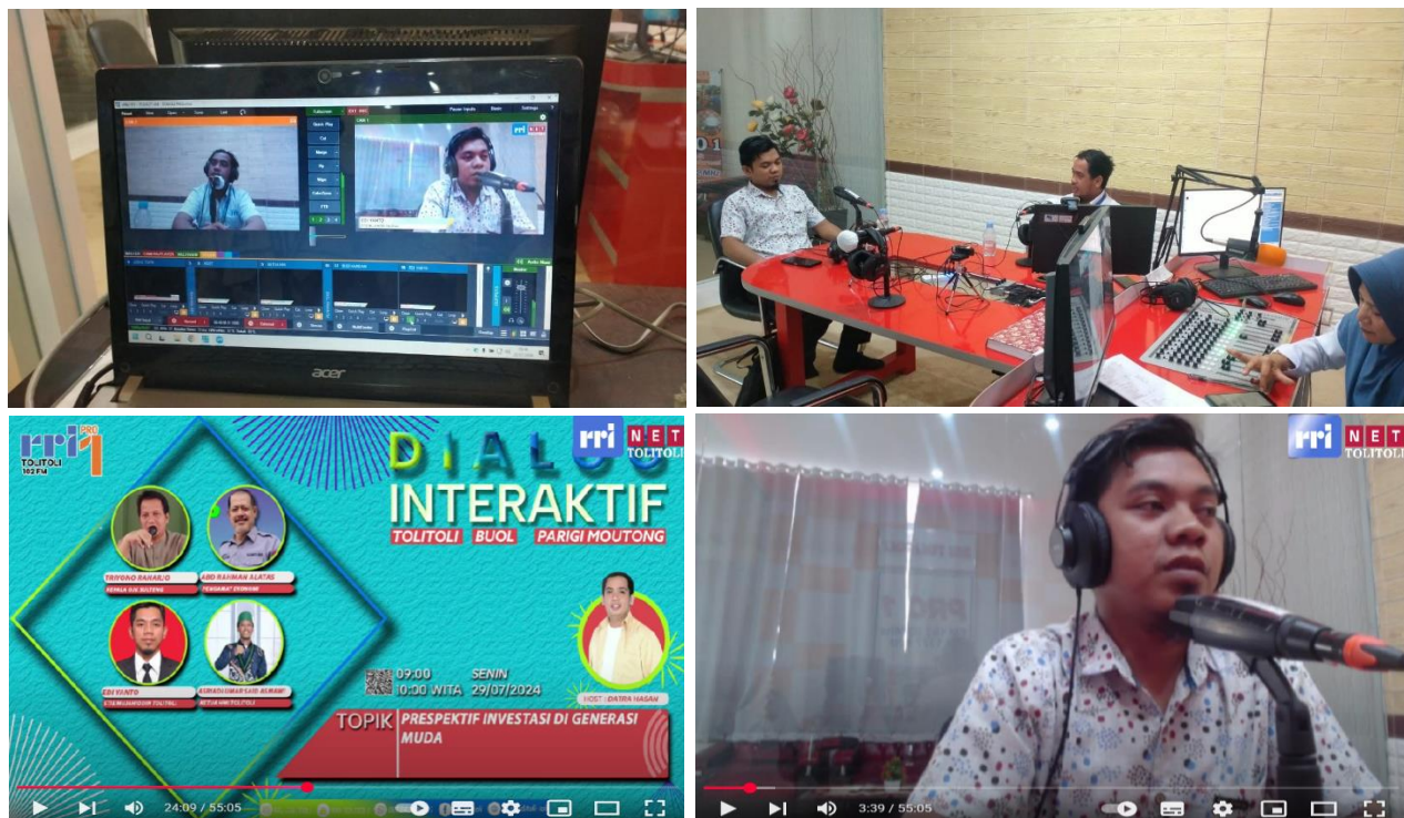
Gambar 2. Pelaksanaan FGD di Studi Pro 1 RRI Tolitoli

Hasil dari pelaksanaan kegiatan diantaranya adalah: 1) peningkatan pengetahuan dan pemahaman tentang investasi khususnya investasi berkelanjutan, 2) investasi pada generasi muda, 3) Investasi yang cocok bagi generasi muda dalam upaya meraih masa depan yang cerah dari sisi finansial guna mendukung Tujuan pembangunan Berkelanjutan di daerah. 3) Video streaming youtube di chanel RRI Tolitoli bertajuk Dialog Interaktif RRI Tolitoli-Buol-Parigi Moutong pada link: https://www.youtube.com/watch?v=s5yOi3WI__o&t=1449s .